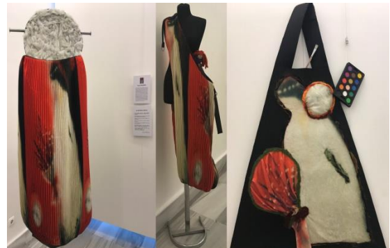
Nuriye Çevik İşgören