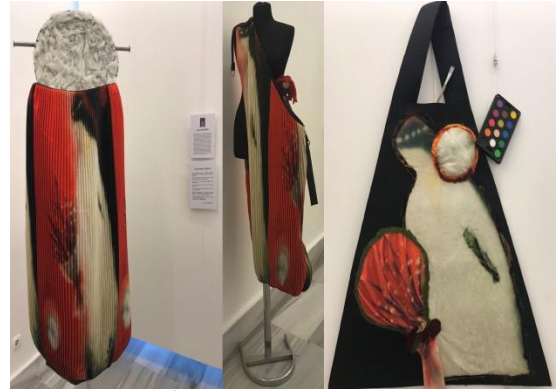
Nuriye Çevik İşören