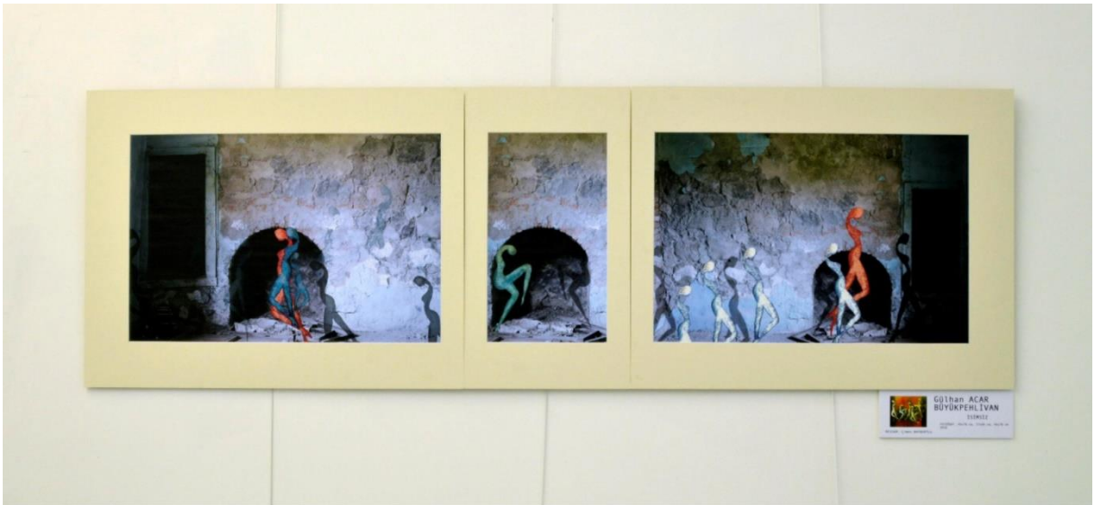
Gülhan Acar Büyükpehlivan